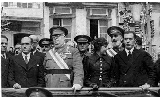
Presidencia de desfile militar con las máximas autoridades civiles y militares de A Coruña. Fondo Suárez Ferrín 2

predominan recepciones y banquetes oficiales. Además y junto a algunas fotografías de los actos hemos tenido la oportunidad de recuperar una filmación del año 1934, de escasamente minuto y medio, en la cual se recogen diversos eventos realizados con motivo de la única visita del Presidente de la República D. Niceto Alcalá-Zamora a Galicia, en agosto de 1934.