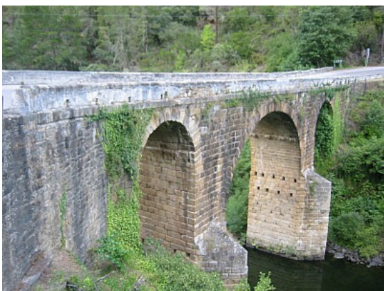
Ponte Bibei.-Trives (Ourense) 21

Buena parte de los lugares a los que con objeto de conmemoración y homenaje, se