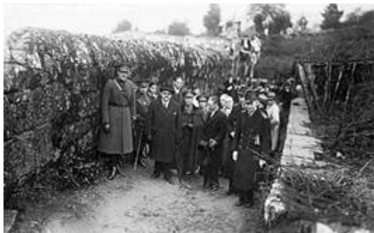
Visita del alcalde de Vigo al cementerio de Pereiró 5

Pero es además la memoria transmitida entre generaciones la que verdaderamente actualiza esas imágenes, algunas de las cuales –u otras semejantes– fueron publicadas por la prensa de la época en otro contexto.