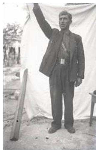
Fondo Quiñoy Pandelo 7

Así como también lo es, en vivo contraste, esta otra imagen en la que años después, en otra fotografía privada se incorporan elementos ideológicos. El militante de Falange, uniformado, saluda a la romana, con un telón de fondo con el que se pretende destacar la figura al tiempo que remedar las convenciones del género del retrato de estudio. Es sin embargo el uso de la fotografía privada, en un desencuadre del telón trasero, la que nos permite descubrir otra realidad detrás de la representación ideológica construida y asomarnos en la esquina izquierda a la casa rural y emparrado que en realidad sirven de entorno al retrato.