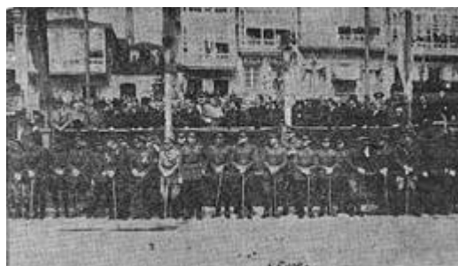
Imagen de prensa del mismo desfile de la izquierda 3