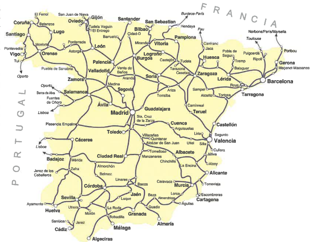
Mapa de los ferrocarriles españoles en 1972.

En 1975 se produjo la incorporación de 38 locomotoras de línea de la serie 333, pasando a remolcar los trenes de viajeros más importantes en los trayectos no electrificados e incluso en alguno de estos. Las 333 sustituyeron con dichos trenes a las 4000, que caían ya en un estado de conservación lamentable.