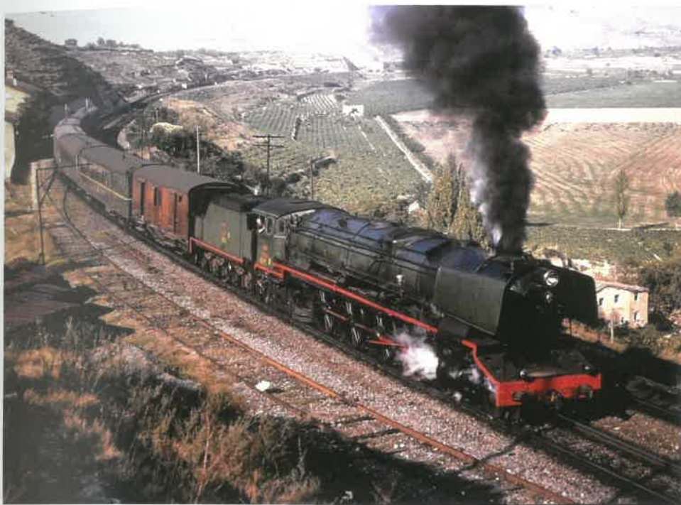
Locomotora 242F-2000 en cabeza del rápido Bilbao-Zaragoza reforzado.